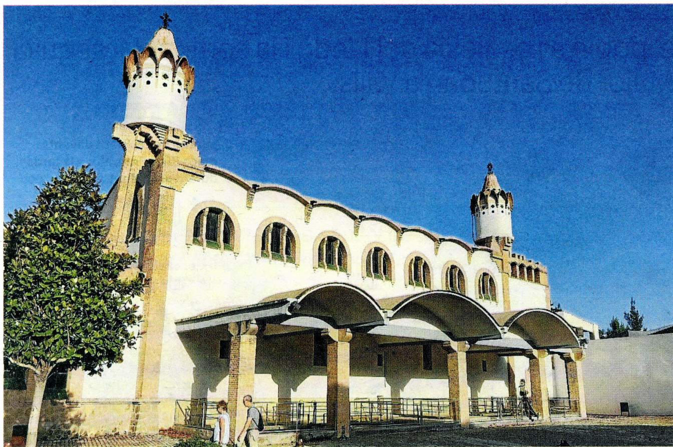
El celler modernista de Gandesa, considerat una de les catedrals del vi, ahir.