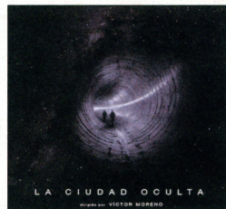
LA CIUDAD OCULTA