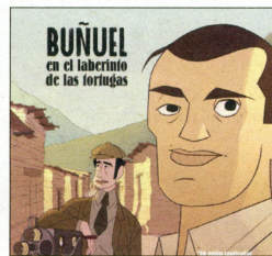
BUNUEL EN EL LABERINTO DE LAS TORTUGAS

projeccionaran, ha destacat títols com Ojos negros , la guanyadora de la Biznaga de Plata del Festival de Màlaga, i que servirà per a inaugurar Mónfilmata el dissabte 29 de juny. L'acte comptarà amb la presència de Mar-