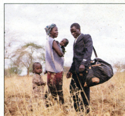
GRÀCIES PER LA PLUJA

Film d'animació sobre el rodatge del documental Las Hurdes de Luis Buñuel. Un film de cinema dins del cinema. Projecció amb 'FoodTrucks' i la presència del director d'art. Lloc: Pati escola Carles III la Ràpita. Passi: 3 de juliol a les 22 h.