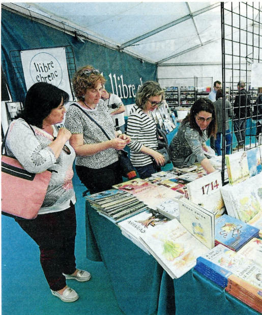
La gran vela de la Fira del Llibre Ebrenc, ahir.