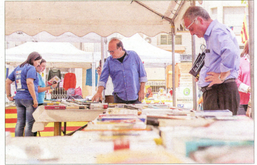
La plaça de Dalt és el centre neuràlgic de la Fira del Llibre Ebrenç.

La programació de la Fira del Llibre Ebrenc inclou la celebració de tres taules rodones sobre temes com els reptes i oportunitats de la lectura en l'època dels dispositius mòbils o el disseny de propostes literàries lúdiques que interpel·lin els infants, joves i les famílies. Una tercera taula abordarà l'anàlisi de dietaris i llibres de memòries com a eines per a co-