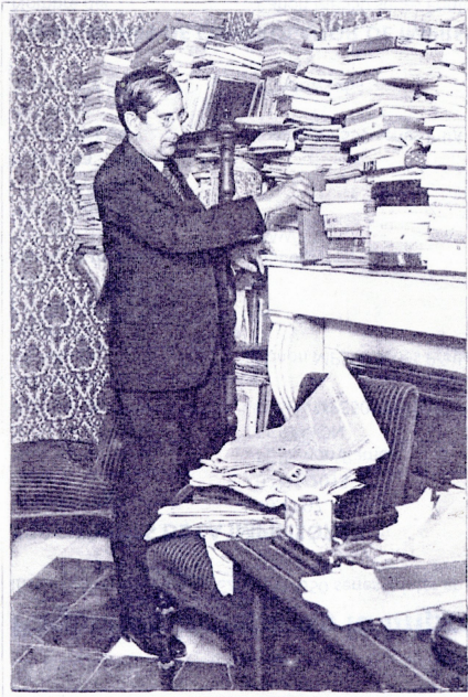
Marcelino Domingo sigue siendo, después de su exaltación al Ministerio, el hombre modesto y sencillo de siempre. Intelectualmente activo, bello espíritu, en un modesto cuartito de trabajo, rodeado de libros y periódicos.

— Efectivamente, desde hace poco más de un mes, Marcelino Domingo ha dejado de ser el político perseguido, de romántica historia, para convertirse en gobernante, en ministro de los maestros que le idolatran porque empezó como ellos, peor que ellos, y de los estudiantes, que tienen en él un ejemplo magnífico. Pero a pesar de todo, sigue siendo el mismo. Ni siquiera ha cambiado de casa, y continúa en el cuarto de su antigua pensión como un estudiante o como un bohemio. Hace bien. Este cuarto, que abre su balcón sobre un jardinillo, tiene un íntimo aspecto romántico, como su dueño. — MAYA.