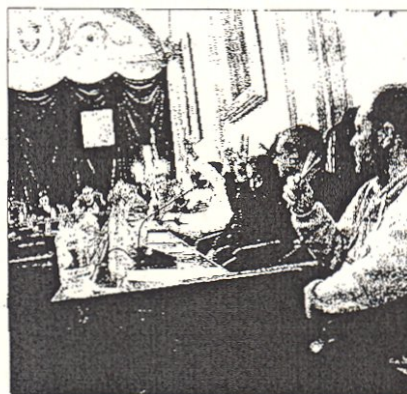
Una sessió plenària de l'Ajuntament de Valls, en què en més d'una ocasió s'ha debatut el tema dels sous ■ A.T.

més el sou -un 10%-, ha estat l'alcalde, i de manera proporcional". El batlle afirma que totes les retribucions dels regidors també s'han abaixat. I, pel que fa a l'import de les retribucions per assistències a plens o juntes de govern, Albert Batet és categòric: "Comparativament estem per sota dels altres ajuntaments del Camp de Tarragona". ■