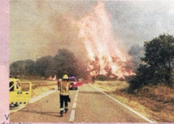
Alto riesgo de incendios en el interior ebreense

Un informe señala en la provincia decenas de infraestructuras vulnerables a la subida del nivel del mar, incendios o las olas de calor: de tramos de la AP-7 al ferrocarril o al interior ebreense