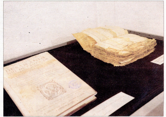
Imatge d'alguns dels elements que es poden veure a l'exposició a l'Arxiu Comarcal del Baix Ebre.