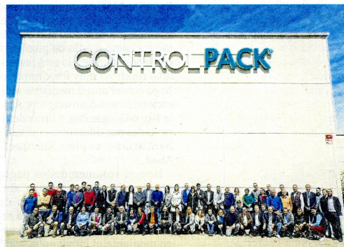
Trabajadores y trabajadoras en la nueva sede.

● Certificado de excelencia en gestión empresarial Evaluación realizada con más de 50 indicadores.