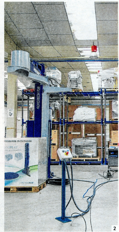
1. Trabajadores en la línea. Proceso de manipulación de material de embalaje. FOTO: CEDIDA 2. El pasado año incrementaron las ventas en maquinaria un 25%. FOTO: CEDIDA